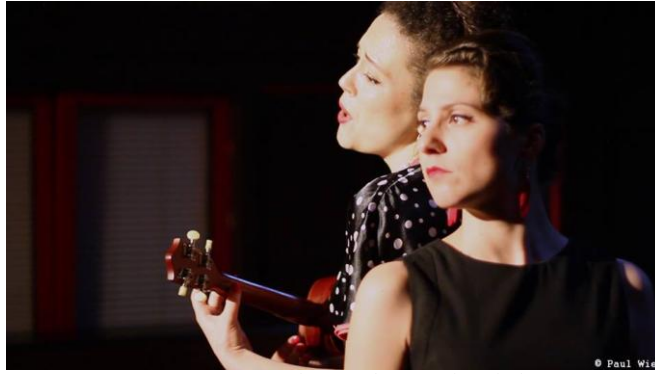
Bar 2000